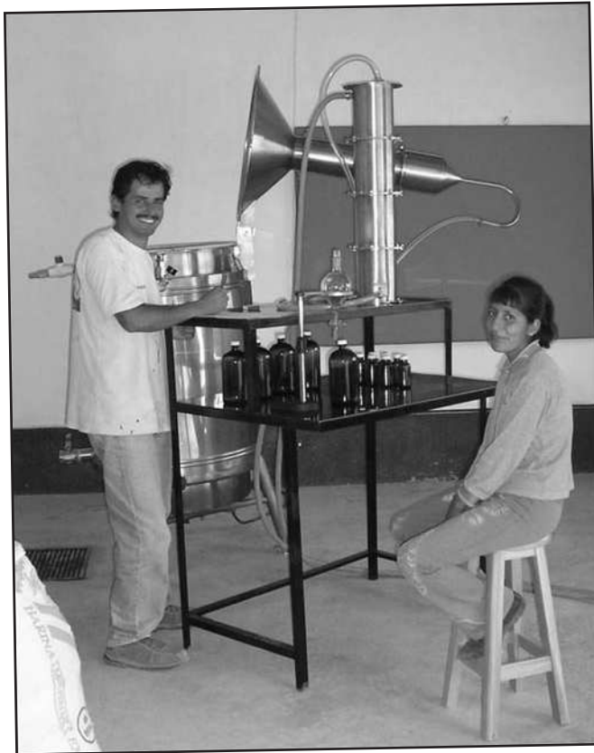
Destiladora und Arbeitstisch

Frühstück oder Mittagessen gehen, während die anderen beiden die Stellung hielten. Zwischendurch musste ich alle 3 Stunden schnell in mein Zimmer flitzen und die vier kleinen Kätzchen versorgen. Abends um 20 Uhr waren alle v i e r Destillationen beendet, die letzte in weniger als 2 Stunden. Nun müssen wir noch Proben nach Lima schicken und die Öle auf ihre Qualität hin analysieren l a s s e n .