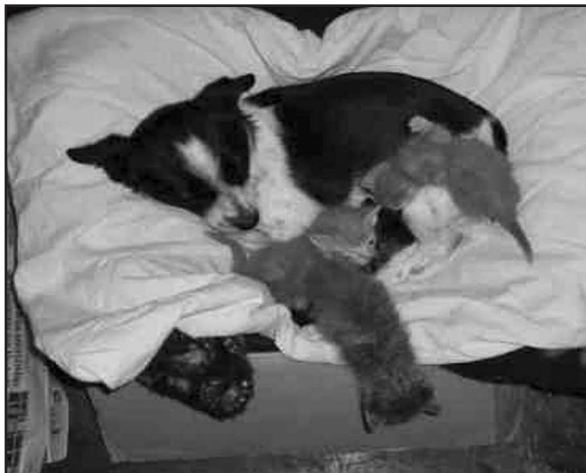
Maxi und ihre Adoptivkinder

Nach dem Mittagessen und einem erneuten Umtrunk mit guter Milch probierte ich es erneut.